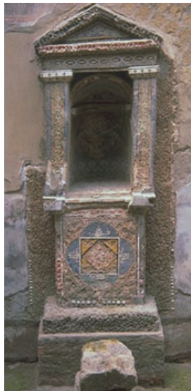
Fig.1 Larario della Casa dello Scheletro