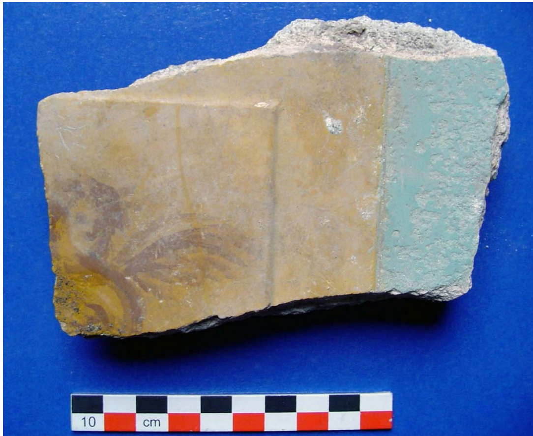
Fig. 2 Frammento d'intonaco in I stile figurato con Erote